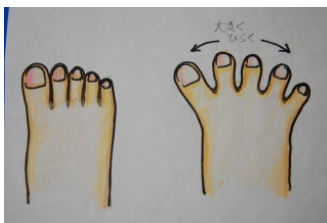
図3) 立った状態で足指を開いて地面をつかみ、かかとを1cm程上げる。3秒位静止し、ゆっくりかかとを下ろします。ぐらつかないようにしっかりバランスをとりましょう。